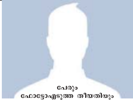
പേരും ഫോട്ടോ എടുത്ത തീയതിയും